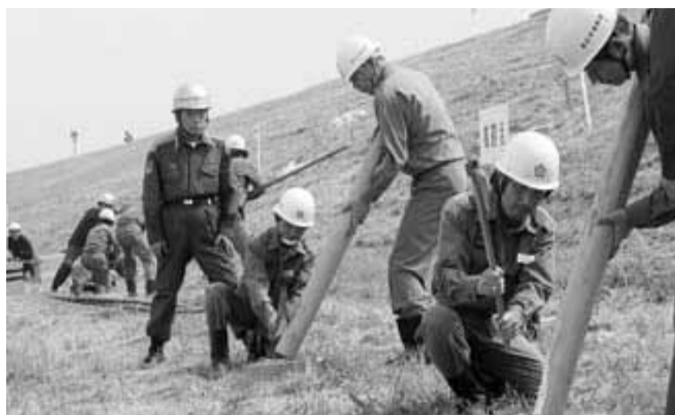
万が一の災害に備え 7月24日、松戸市の江戸川河川敷 で東葛中部地区連合水防団水防演習が行われました = 写真。流山市 からは消防団員や建設協会の方々が参加。猛暑の中にもかかわらず スムーズな連携プレーで様々な水防工法を行いました。

災害時の地域の役割 大地震などの大きな災 害が発生した場合、火災 や建物の倒壊などによる 交通遮断から、消火・救 出・救助活動に支障をき たすことが想定されます。