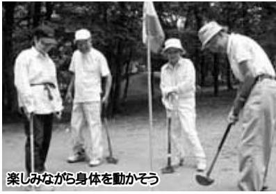
楽しみながら身体を動かそう

軽スポーツのついで 「フライングディスク ゴルフ」 日時：8月29日(日)8 時30分(受け付けは8時)