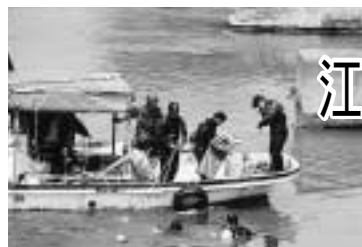
自衛隊による爆弾回収作業

四月二十二日、江戸川の旧流山橋付近で、旧日本軍が訓練に使用した爆弾八個と小火器弾など十個が回収されました。国土交通省江川河川事務所を要請を受け、陸上自衛隊東部方面後方支援隊第一〇二不発弾処理隊二人、海上自衛隊横須賀地方総監部横須賀警備隊水中処分隊五人が撤去作業にあたり、十五キロコンクリート訓練爆弾(信管なし)五個と四キロ演習爆弾(火薬なし)三個を