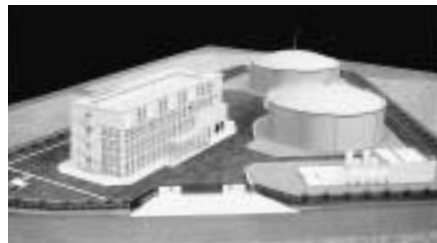
新規浄水場のイメージパース

樹木や森林は、地球環境や人間の健康的な生活にとって欠かせないものです。地球温暖化の防止をはじめ、騒音や風害、土砂崩れなどの災害を防ぐなど、安心で潤いのある暮らしを支えています。