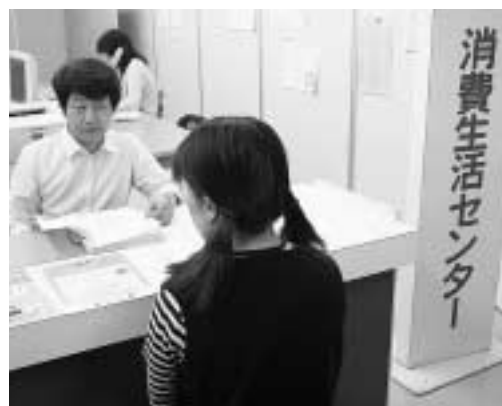
お気軽に消費生活相談のご利用を