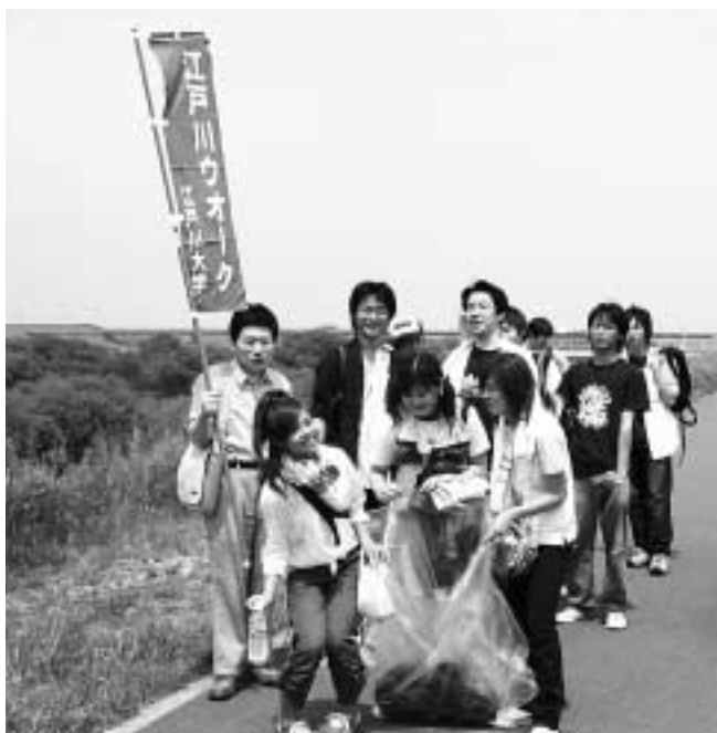
私たちができるところから 4月30日、江戸川大学の1年生がごみを拾いながら江戸川堤を歩く江戸川ウォークが行われました。環境デザイン学科などを持つ同大学の授業として、約500人の学生や教員が、空き缶や雑誌などを拾いながら流山から葛飾まで22キロを歩きました。