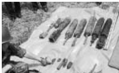
回収された爆弾と銃弾類

四月二十二日、江戸川の旧流山橋付近で、旧日本軍が訓練に使用した爆弾八個と小火器弾など十個が回収されました。国土交通省江川河川事務所を要請を受け、陸上自衛隊東部方面後方支援隊第一〇二不発弾処理隊二人、海上自衛隊横須賀地方総監部横須賀警備隊水中処分隊五人が撤去作業にあたり、十五キロコンクリート訓練爆弾(信管なし)五個と四キロ演習爆弾(火薬なし)三個を