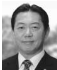
井崎市長のメッセージ