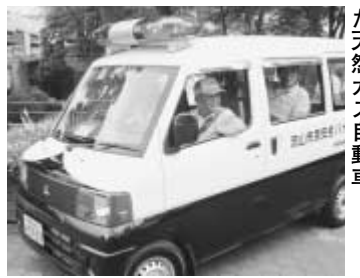
京和ガス(株)から寄贈された天然ガス自動車

この表彰は、それぞれの功績を郷土の歴史に深く刻み、永くその栄誉をたたえるもので、昭和48年に創設された本市最高の顕彰制度です。