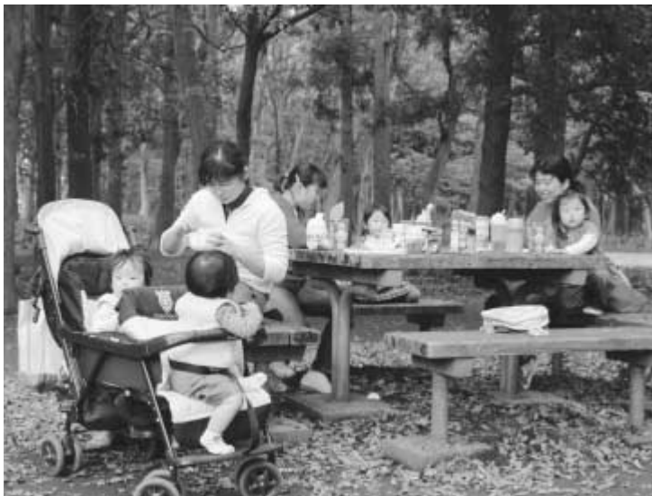
樹木に囲まれた公園は私たちの憩いの場