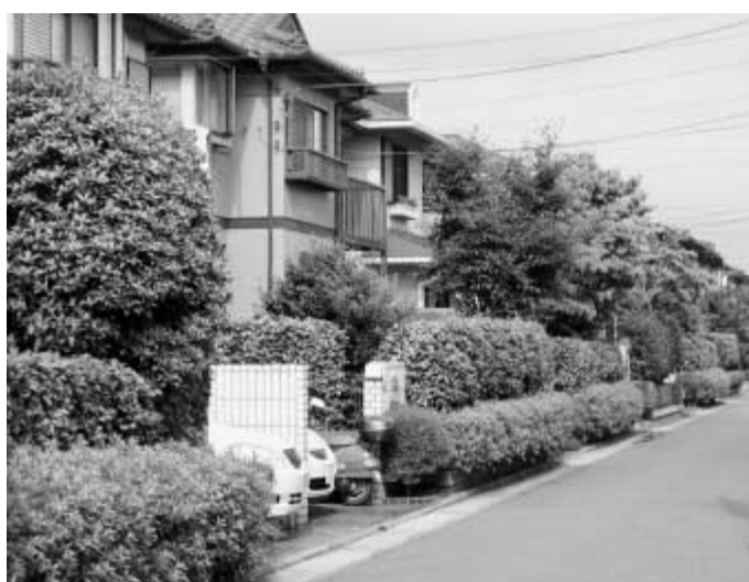
緑のまち並は、住む人へやすらぎを与えるだけでなく、まちの価値も高めます