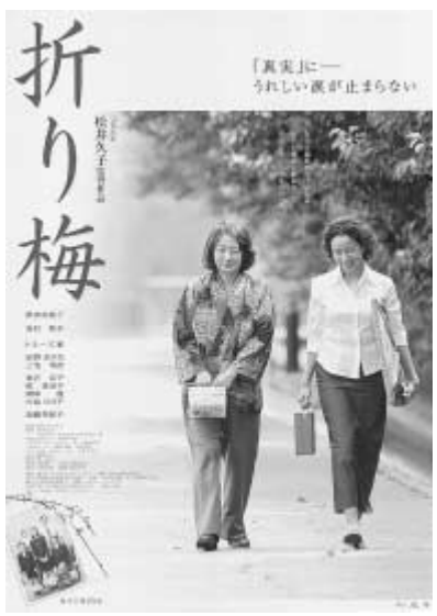
家族の絆を描いた感動的名作

▽日時 12月3日(土)12時30分(開場) 〽場所 〽文化会館 〽内容 〽講演