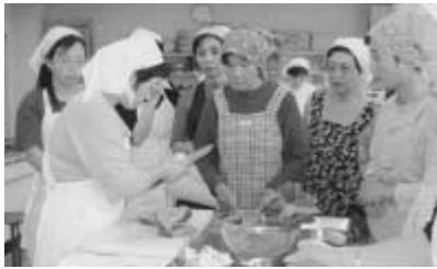
南流山センターで行われた地区栄養講座

健康づくり推進員は、各地域で市民を対象として行われる栄養講座やウォーキングのついでなどに参加し、市民の健康づくりをサポートするボランティアです。自分自身や家族の健康管理はもとより、地域ぐるみでの健康づくり活動に参加しませんか。