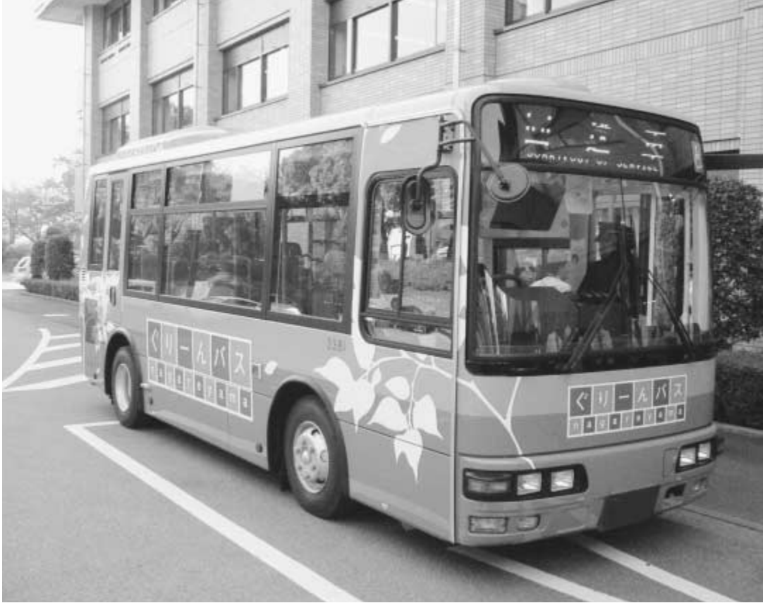
18日に、お披露目会と試乗会。お気軽にご参加を