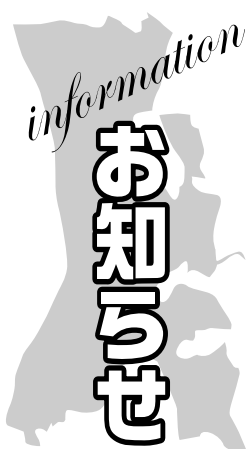
★印のあるものは市主催のもので