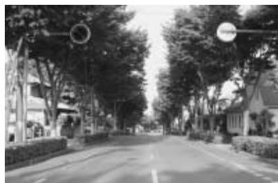
大きく違うのは、流山セントラルパーク駅には、森と見間違うほどの市総合運動公園があり、流山おおたかの森駅の近くに、市民運動で残したオオタカが棲む市野谷の森があります。

今夏、開業したつくばエクスプレスによって、市内には3つの新駅ができました。南流山駅と流山おおたかの森駅には快速も停車し、秋葉原とそれぞれ20分、24分で結ばれました。この所要時間は、東京・赤羽間（20分）、東京・荻窪間（25分）と同じです。