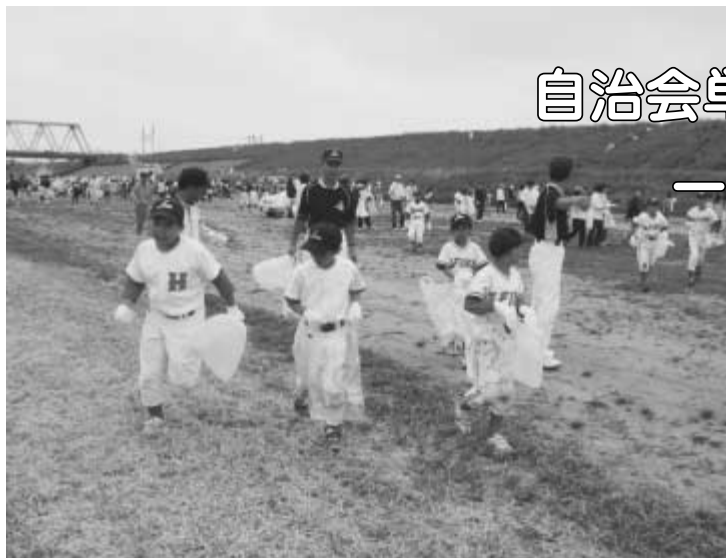
自分たちのまちは自分たちできれいにしよう