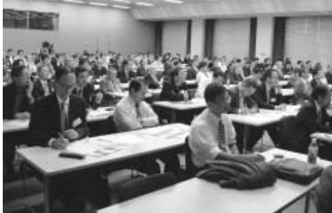
多くの企業や団体が参加

グリーンチェーン戦略研究会が設立 10月20日、西初石の三井生命研修センターで「流山グリーンチェーン戦略研究会」の設立記念シンポジウムが開催されました。このグリーンチェーン戦略とは、緑をつなげることで都市の価値を高め、都心から一番近い「森の街・流山」の実現を目指すものです。当日は、市内外の