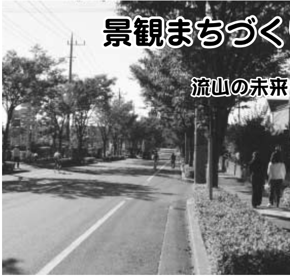
緑と住宅の調和のとれたまちなみ