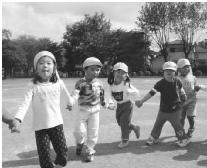
お友だちがいっぱい、楽しいな

「募集要領」 ▽入所の条件①保護者(土・日曜、祝日を除く)②各保育所・保育園(日