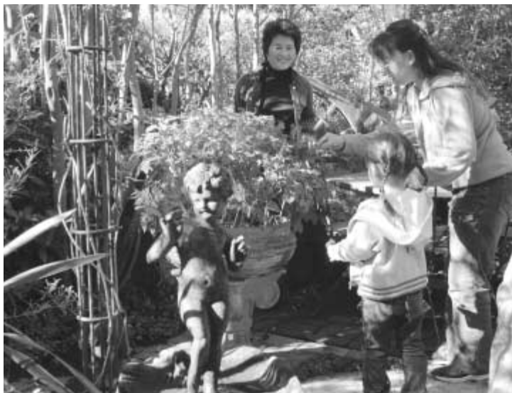
ご覧いただける庭は20カ所

私たちが丹精込めて作り上げた自慢のオリジナルガーデンを、ぜひ、ご覧くださると、ことし5月に設立された「ながれやまオープンガーデンクラブ」が、花樹あるまちを目指しスタートさせました。 「花樹あるまち」(国府田誠会長)では、きょう1日からオープンガーデンをスタートさせました。オープンガーデンは、個人の庭などを一般に公開するもので、ガーデンの本場イギリスが発祥の地。近年、国内でもオープンガーデンを行う個人や団体が増えていますが、首都圏ではあまり例がなく、千葉県内での組織的なオープンガーデンは、おそろしく初とのこと。