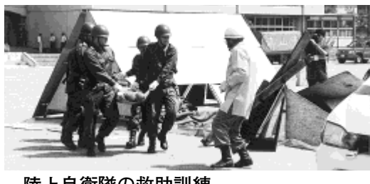
陸上自衛隊の救助訓練

市では、いざというとき適切な行動が取れるように、防災関係機関の協力を得て総合防災訓練を