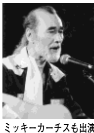
ミッキーカーチスも出演