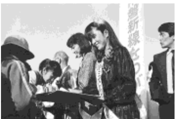
市民まつりでも誘致呼びかけ

市民まつりでも誘致呼びかけ 以来、市では、流山の未来を大きく左右する交通プロジェクトとして、その建設促進に力を尽く