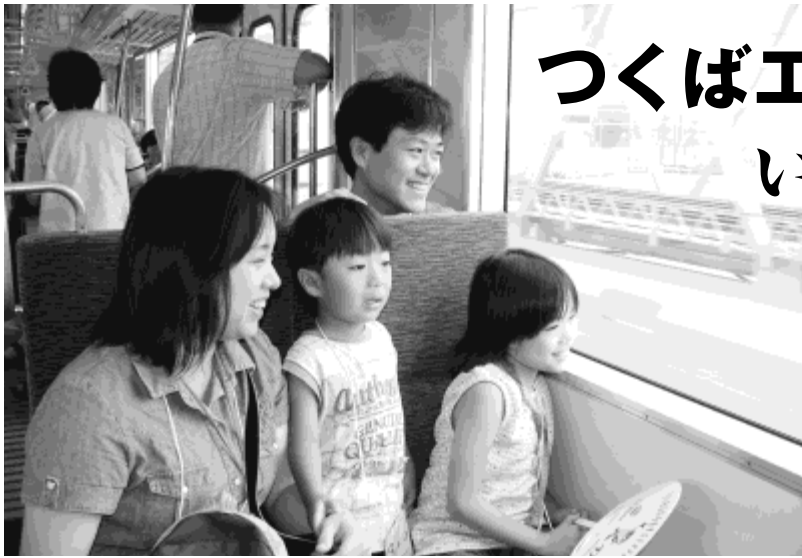
8月6日、一足早く市民ら1,800人が試乗