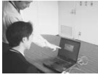
自分のペースで学べます

①メール、インターネット②ワード③エクセル④パソコンの入力方法から知りたい等、返信用に宛名を明記し、5月21日(必着)までに〒2700176流山市加1-16-2流山市文化会館