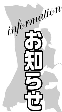
★印のあるものは市主催のものです