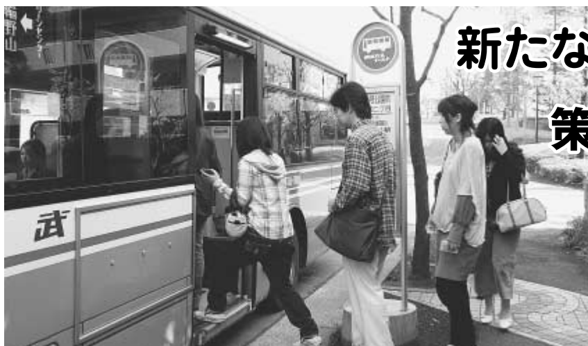
3月22日に新たに開業した南流山駅からクリーンセンターを結ぶバス路線も、多くの市民が利用しています。このほか、つくばエクスプレスの開業に合わせて新たな民間バス路線も計画されています