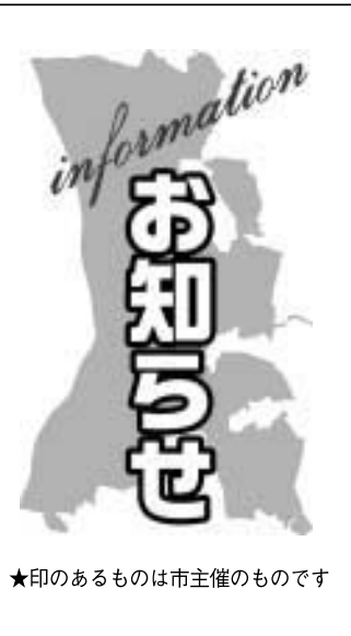
★印のあるものは市主催のものです

★市三輪野山第2土地区画整理事業事業計画等の変更認可図書の縦覧 ▽縦覧時間=8時30分~17時20分(土・日曜、祝日等を除く)▽場所=まちづくり推進課 3月11日付で変更認可された事業計画(事業期間を平成19年3月31日まで延伸など) まちづくり推進課 ☎ 7150-6090