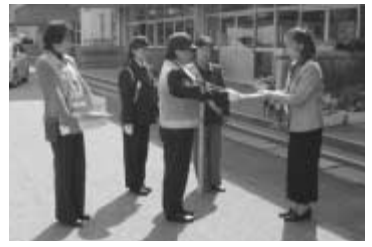
流山北小にメッセージを伝達

小学校の新入生児童を交通事故から守るための交通安全メッセージを伝える伝達式が、四月六日に市役所前の公園で行われ、同運動初日に行なわれた交通安全メッセージの伝達は、小学校の新生やドライバーに交通事故防止を呼びかけようといわれたものです。メッセージは、入学のお祝いと一緒に「①道路を渡る時は横断歩道で