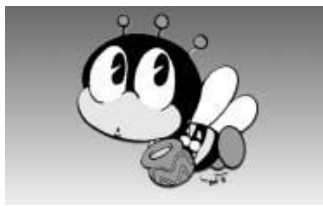
生涯学習のマスコット マナビ