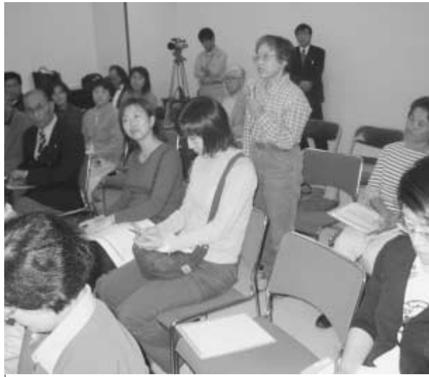
子育てについてもみんなで話し合い

今年九月から五月十日まで、市民の皆さんと市長が直接話し合いながらまちづくりを考えるタウンミーティングを五回にわたり行っています。次世代育成支援行動計画を策定するに当たっては昨年十月、各地で子育てタウンミーティングを開催しました。その席で寄せられたご意見なども今回の計画に反映されています。