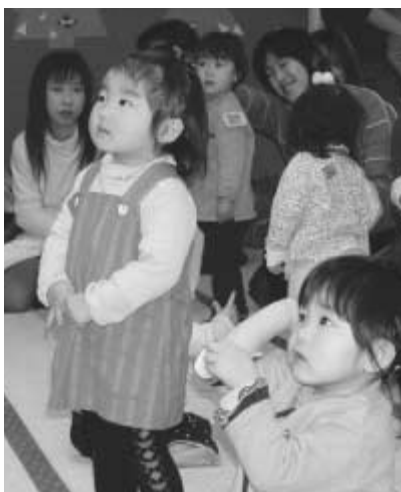
次世代育成支援行動計画と障害者支援計画はホームページや図書館などで見られます

子育てを単に家庭の問題としてだけでなく、地域全体で取り組むべき問題として捉えていくことが必要です。特に、子育て支援には、市民の主体的活動が重要になります。この計画では、行政だけでなく、自治会、地域の人々、民生(主任児童)委員、地区社会福祉協議会、NPO法人、ボランティアや企業、各種関係施設・団体等が、