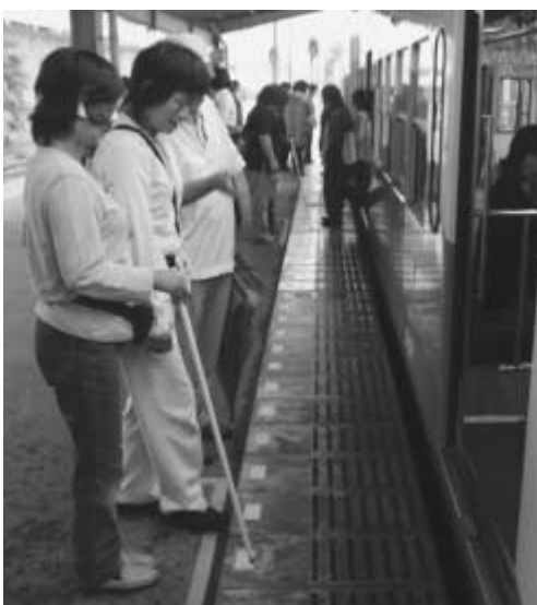
目の不自由な方のためのガイドヘルパー講習会

※ピアカウンセラー…障害者が、自らの体験に基づいて、同じ仲間として生活技術の方法を伝え合い、支え合う役割を果たす人 ※レスパイト施設…介護を必要とする方々を一時的に預かりして家族の負担を軽減する施設