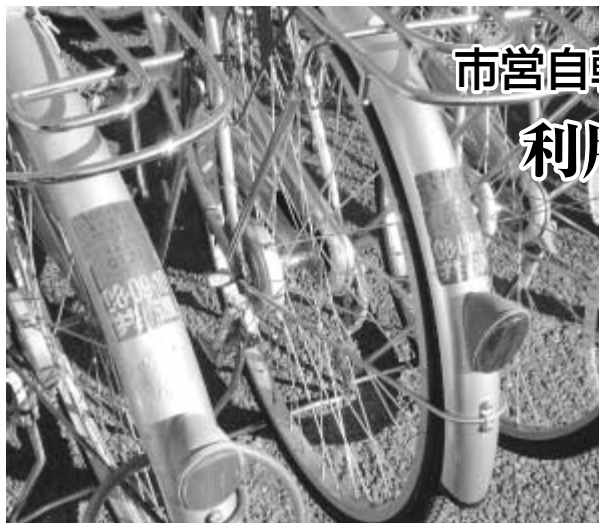
利用登録証(ステッカー)は、4月1日からの利用に合わせて貼付してください。

を継続利用される方および新規利用の申請をされた方(抽選の結果当選した方)に、3月上旬に「自転車駐車場登録通知書兼登録手数料領収書」を送付します。