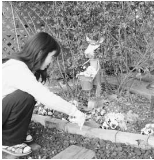
個人の庭から花と緑の街へ

あなたの自慢のお庭や花壇を見せてください。市では「第6回 ガーデニングコンテスト」を実施します。 個人の庭や生け垣、ベランダ、寄せ植えなどのほか、商店や工場自治会の花壇など対象