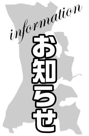
★印のあるものは市主催のものです