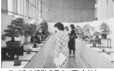
日ごろの活動成果をご覧ください

— 自転車の事故が増えています — 上半期の事故では、自転車に関する事故の増加が見られます。自転車と歩行者、自転車同士など113件の事故が発生。自転車事故は、自宅周辺の道路で発生することが多く、全体の48.8%を占めます。安全運転を心掛け、走り慣れた場所でも十分に注意して運転しましょう。 流山警察署 ☎7159-0110