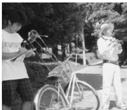
8月19日に行われた熱環境調査

と学生がグループで、100カ所を自転車で調査しました。本市では、つくばエクスプレス沿線開発において、グリーンチェ