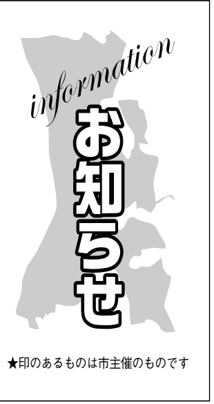
★印のあるものは主催のものです

10時~13時▽場所 初石公民館▽対象/定員 身体障害者手帳をお持ちの方/20人(先着順)▽内容 調理実習「中華風冷やしうどん、トマトのサラダ」など、自助具の紹介▽参加費 材料費等実費▽持ち物 エプロン、三角巾▽申し込み 9月11日12時までに電話またはファックスで身体障害者福祉センターへ 圏身体障害者福祉センター ☎7155-3638 / FAX 7153-3437