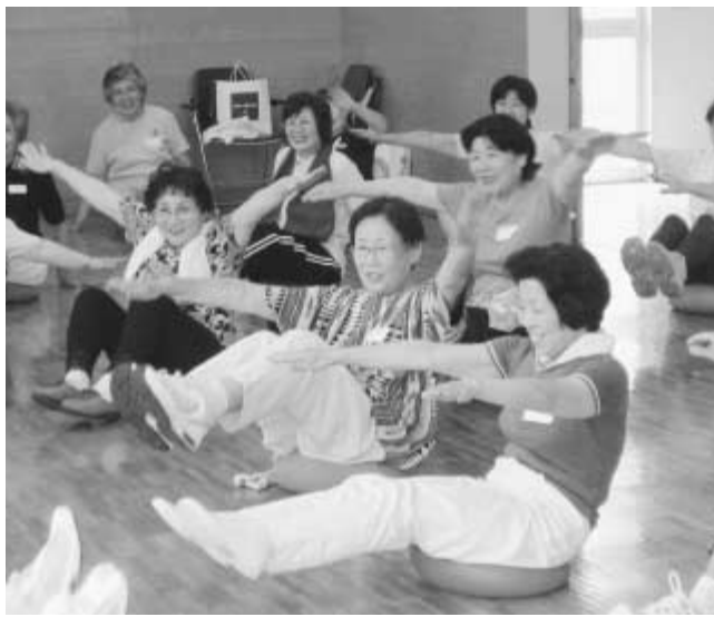
自分に合った運動を

糖尿病や高血圧症などの生活習慣病予防には、日ごろの運動が大切です。 保健センターと生涯学習課スポーツ振興係では、「中高年齢者のための健康・体力アップ」