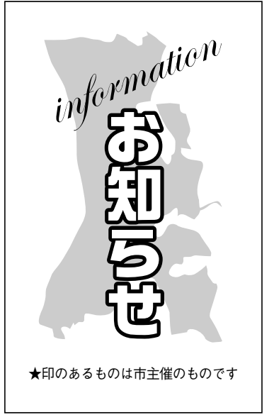
★印のあるものは市主催のものです