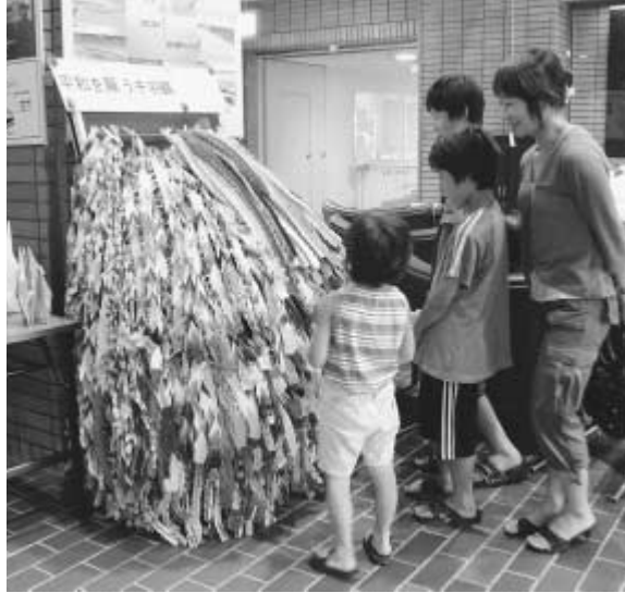
昨年寄せられた約6万8000羽の折り鶴

昭和62年に「平和都市宣言」を行い、今年度で20年目を迎えます。市では、昨年に引き続き終戦記念日の8月15日に合わせて、広島平和記念公園に市民手づくりの「平和を願う千羽鶴」を贈る予定です。みんなで鶴を折りながら「平和」について考えてみませんか。皆さんの平和への想いを広島に直接お届けします。