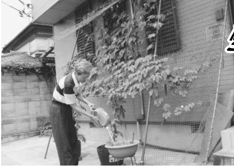
ゴーヤで涼しく、おいしく(江戸川台東のお宅で)