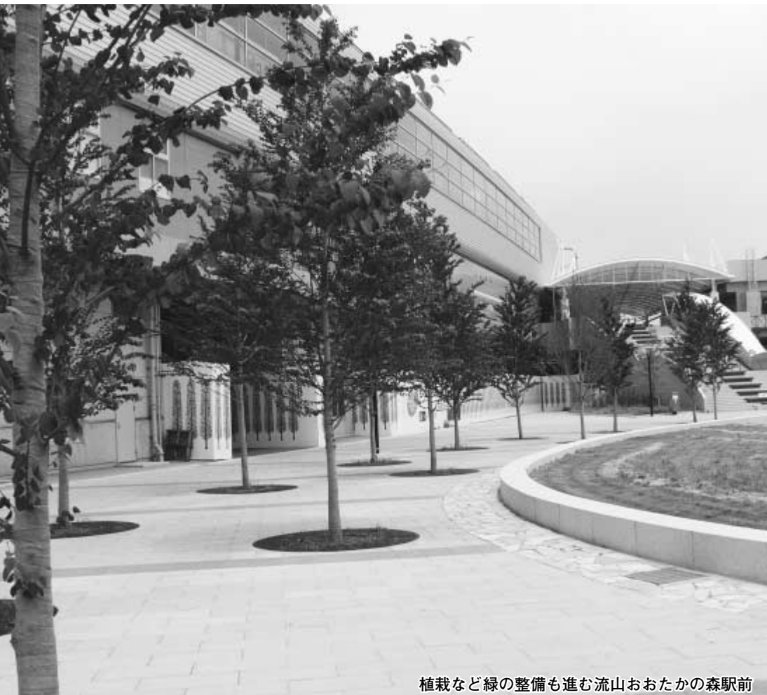
植栽など緑の整備も進む流山おおたかの森駅前