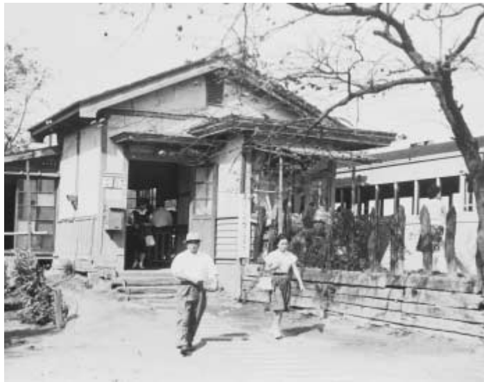
昭和40年ごろの流山線赤城駅(現在の平和台駅)

来年1月1日に市制施行40周年を迎える流山市。都心から約30キロ圏内に位置し、鉄道交通として、現在のJR常磐線や東武野田線、総武流山電鉄があり、昭和28年には常磐