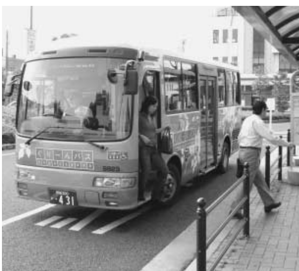
7月5日に延べ利用者が10万人を突破したグリーンバス

市では、つくばエクスプレスの開業により新設・再編された路線バスやグリーンバスの運行ルート、停留所等を記載した「柏市・流山市バス路線マップ」を柏市と共同で作成し