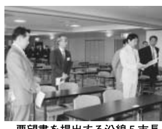
要望書を提出する沿線5市長

ご意見の提出は、ホームページからメールでお送りいただくか、〒270-0192流山市役所企画政策課へ郵送またはファックスで。