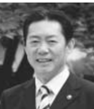
井崎市長からのメッセージ