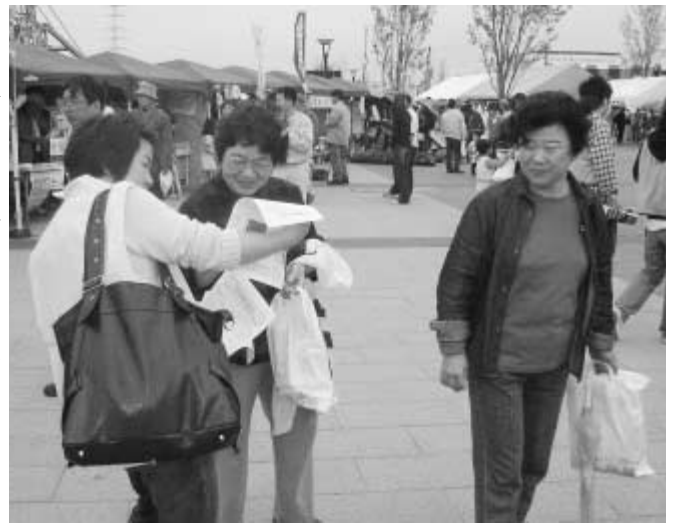
市民協議会では、イベントなどの会場でも市民の皆さんの意見をお聴きしています

相当分まで、固定資産税額の2分の1が減額▽申請方法①現行の耐震基準に適合した工事であることの証明書と領収書の写しを添えて、指定住宅性能評価機関・指定確認検査機関等になります。②固定資産税の減額については、資産税課☎7150-6074 / 証明書については、