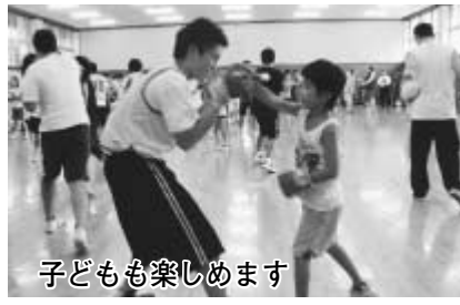
子どもも楽しんでいます