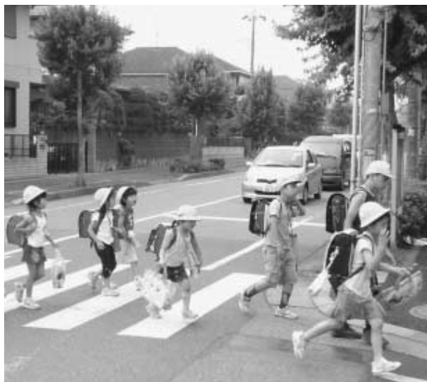
正しい交通マナーで事故防止を