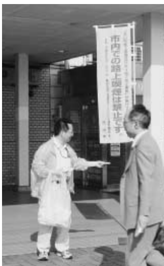
5月25日に江戸川台駅前行われた路上喫煙禁止キャンペーン

そこで、こうした路上喫煙による吸い殻のポイ捨て等によるごみ散乱を防止するため、ポイ捨て防止条例を改正し、4月1日から施行となりました。 今回の主な改正点は、携帯灰皿の使用を除く市内全域での路上喫煙を禁止するとともに、南流山駅および江戸川台駅周辺を重点区域に指定(図参照)し、この区域での路上喫煙やごみのポイ捨ての違反者に対して指導、勧告を行い、従わない場合には過料(2000