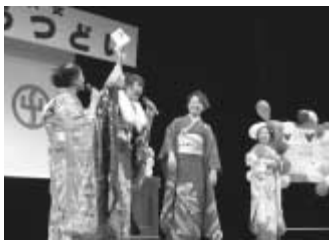
新成人手づくりの成人式

この実行委員は、市内中学校卒業生の中から学校推薦により選出される委員と協力して成人式の企画運営をするもので、私立中学校卒業生や、途中転入者なども含め広く公募します。