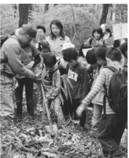
おおたかの森を散策

5月7日の流山グリーンフェスティバルでは、あいにくの天候の中、多くの皆さんが予定どおり4回に分かれ、おおたかの森体験ツアーを楽しみました。NPOさとやまの案内でオオタカの営巣が確認されている市野谷の森を歩き、残された自然の森を満喫していました。また、このフェスティバルでは、地元自治会をはじめNPO法人エヌブランド、国連支援交流協会、流山高校園芸術科、ガーデニングクラブ花恋人、江戸川大学、商工会など多