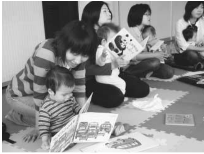
5月18日に中央図書館で行われた「赤ちゃんと楽しむ絵本の紹介」。9組の親子が参加し、お母さんとスキンシップをとりながら絵本を楽しみました。

学校図書室の活動を支援するため、ボランティアの養成講座(流山市子どもの読書推進の会主催)を開催します。