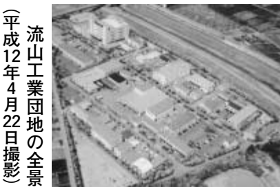
流山工業団地の全景 (平成12年4月22日撮影)

あの時代、新川耕地に工業団地が出来たのは奇跡だと言われた。この奇跡を実現させたのは行政と商工会と工業団地協同組合が三位一体となり、すべてがタイミング良く噛み合ったからといわれる。不思議な縁で良い指導者にも恵まれたのである。昭和の流山産業史の金字塔である流山工業団地づくりに登場した流山っ子たちの話は感動させられる。