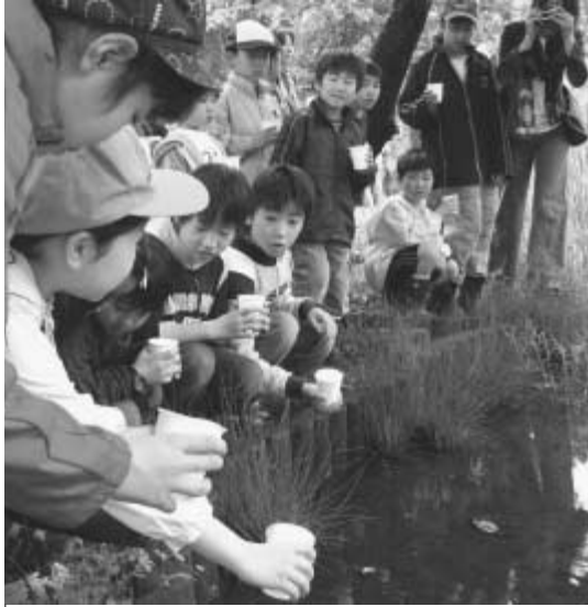
5月14日、約600匹のホタルの幼虫が、子どもたちの手で駒木台調整池に放流されました。放流されたホタルがいつまでも生息できるように、きれいな水環境の保全が望まれます。市では、河川等の水質改善を図り、「豊かで清らかな水に親しめるまち・流山」を目指して、第Ⅱ期生活排水対策推進計画を策定しました。計画の詳細は、環境保全課まで問い合わせを。

みんなの力で未来に伝えるまち・流山」の実現に向け、具体的な数値目標などを設定し各種施策を積極的に進めるためのアクションプラン「環境行動計画」を策定しました。今号では、その概要をお知らせします。