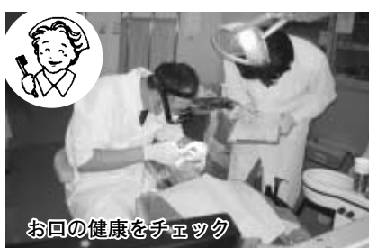
お口の健康を手ツク

ろ何気なく食事をして食べ物を飲み込んでいますが、さまざまな体の機能低下が原因で食事や飲み物がうまくできなくなるので、生きる楽しみや健康維持が難しくなったり、さらに誤嚥性肺炎(誤って食物や唾液が肺に入って起こす肺炎)による入院が多くなり、生活の質が低下して「要介護状態」になることも多いです。 口腔ケアサービスは、「健口体操」、「歯つらつ教室」、「えん下教室」