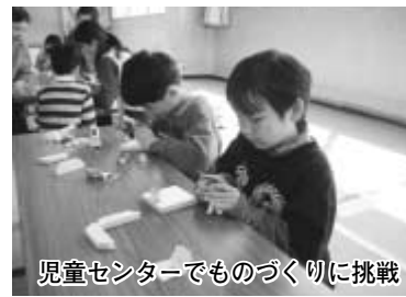
児童センターでものづくりに挑戦

Vol.19 健康づくり&介護予防 ～口腔ケアサービス～ 流山市歯科医師会ホームページ http://nagareyama.cda.or.jp