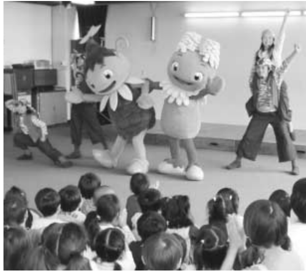
ネポスピロスがやってくる

少子化や児童虐待などが大きな社会問題となっている今、子育てや子どもの成長を社会全体で支援していくようなまちづくりが求められています。公民館 や児童館・センター、子育て支援センター・ゆうゆうでは、毎月さまざまなイベントなどを開催し、子育て中の家庭や子どもたちの成長を応援しています。