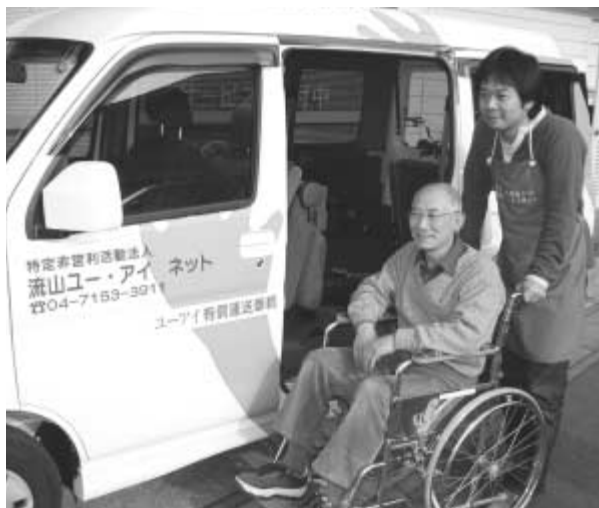
公共交通機関を利用することが困難な方の移動の足としてご活用ください。

NPO法人などが白ナンバーの普通自動車を使って行う福祉有償運送が順調にスタート。このサービスは、タクシーやバス、鉄道などよりも移動サービスです。本市では、県下の市町村に先駆けて、内閣府が進めている構造改革特別区域計画(特区)を活用し「流山福祉輸送セダン特区」の認定を受けました(今年3月から県下全域が認定区域に)。