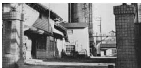
東邦酒類(株)流山工場の正門

掲載写真撮影、デザインまで会員の手づくり。13人で始めたクラブも70人に迫る勢い。オープンガーデンも昨秋の20軒から42軒に広がり、4月末、「2006年版オープンガーデンブック(A5判72ページ500円)を発刊した。5月7日に流山おおたかの森駅前で開かれる「流山グリーンフェスティバル」に参加し、100平方メートルの大きなオオタカの絵を花で描くインフィオリータに協力、7日まで展示されている。こうした活動を通して「花で飾ろう森の街」を呼び掛ける。さらに42軒のオープンガーデンの統一公開を