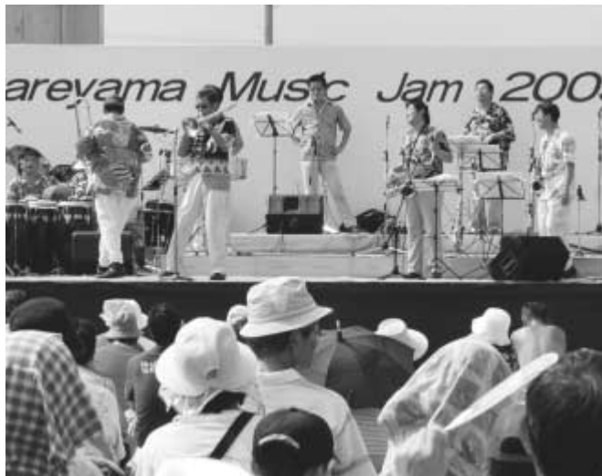
昨年8月、TX開業記念イベントとして開かれたミュージックJAM

同クラブでは、「花樹ある(カジュアル)シティ流山」をコンセプトに、「花ひらく・緑かおる・心つどうガーデンの街」を目指して、さまざまな活動を展開しています。