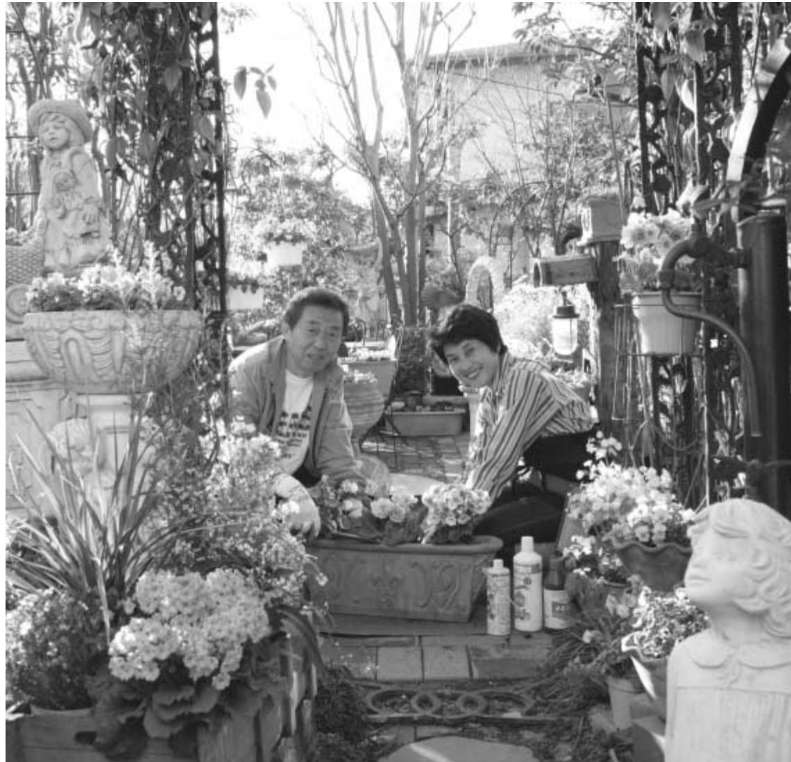
写真は小学館「駱駝」4・5月から(撮影・太田宏昭氏)