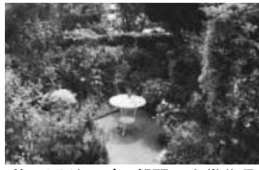
第4回ガーデン部門の金賞作品

「第5回ガーデニングコンテスト」の作品を募集しています。自慢の庭や花壇などを、写真に撮って応募してください。 ▽応募資格 市民または市内に事務所を置く ▽応募部門 ①ガーデニング部門:個人の庭など3㎡以上の緑化②ポットガーデン部門:個人の寄せ植え、ベランダなど3㎡以下の緑化③緑の街並み部門:道路から見た個人の庭や生け垣、自治会、事務所、学校等の花壇などの緑化 ▽応募写真の規格 平成17年7月1日以降撮影でA4判の