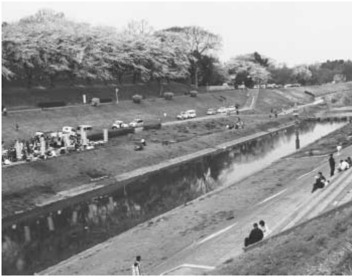
日本屈指の歴史的土木遺産、利根運河は市民の憩いの場

として親しまれている利根運河。ゆるやかな曲線を描く水辺と谷津、台地の緑が織り成す自然の多様さや美しさは首都近郊随一のもの。ゴールデンウィークも近付きました。初夏の一日、利根運河を散策してみませんか。