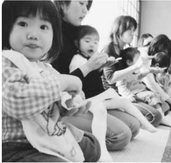
子育てしやすい社会づくりを