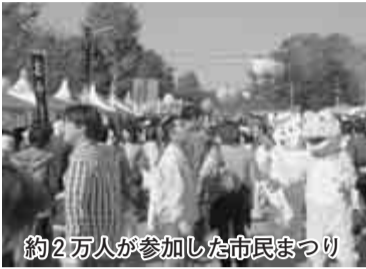
約2万人が参加した市民まつり

当日は、恒例の姉妹・友好都市の物産展をはじめ、メインステージにおける、沖縄エイサー太鼓や大江戸玉すだれ、さらには、流山セントラルパーク駅から会場までの道路で行われた特殊車両展示試乗体験コーナーなど、工夫をこらしたイ