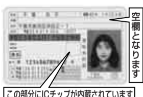
この部分にICチップが内蔵されています

千葉県では、運転免許証の偽造防止やプライバシーの保護等を目的に、平成20年1月4日以降に申請を受理した運転免許証が、すべて「ICカード免許証」となります(写真参照)。