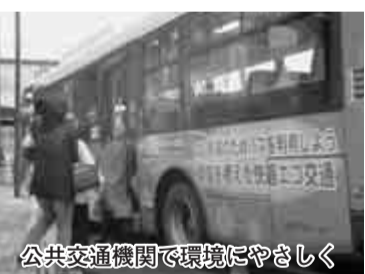
公共交通機関で環境にやさしく

「ぐりんバス」は西初石ルートを新設。利用者も50万人を超えました。また、市内2事業所の協力を得て、高齢者の移動支援事業もスタートしました。路線バスでは南流山駅・流山おおたかの森駅を結ぶルートが新設され、市役所や警察署への公共交通手段も充実。環境保全のために