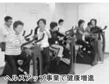
ヘルスアップ事業で健康増進

流山おおたかの森駅周辺では新しい商業施設や事業所が入ったビルなどが次々とオープンしました。駅前都市広場では、きょう15日、地元自治会の協力を得て「市民クリスマスデー」が、22日・23日にもコンサートなどが行われます。こうした駅を中心としたコンサートをはじめ議会主催による議場を開放した「議場コンサート」公募市民や市内音楽3