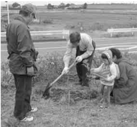
ほっとプラザ下花輪に記念植樹

削減すること定めています。冬季は、暖房機器などの使用でエネルギー使用量が増大し、排出されるCO 2 も増加する季節です。温暖化防止には、一人ひとりの取り組みによるCO 2 削減が必要です。暖房