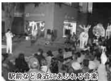
駅前など身近にあふれる音楽

流山おおたかの森駅周辺では新しい商業施設や事業所が入ったビルなどが次々とオープンしました。駅前都市広場では、きょう15日、地元自治会の協力を得て「市民クリスマスデー」が、22日・23日にもコンサートなどが行われます。こうした駅を中心としたコンサートをはじめ議会主催による議場を開放した「議場コンサート」公募市民や市内音楽3