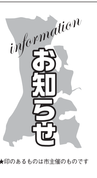
★印のあるものは市主催のものです