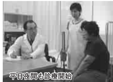
平日夜間も診療開始

ベントが繰り広げられました。好天にも恵まれ人も昨年を2千人上回る、約2万人の方々のご来場をいただきました。なお、今回も「市民手づくり」のまつりを目指し、会場の準備から運営、撤去、清掃まで、延べ308人のボランティアの皆さんにご協力をいただきました。