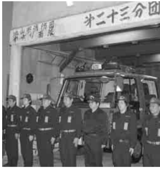
年末も消防署や消防団が警戒パトロールを実施

「歳末火災予防特別警戒」を今月25日から31日まで行います。期間中は、消防本部、消防署、消防団が市内全域で警戒パトロールや広報活動を実施しま