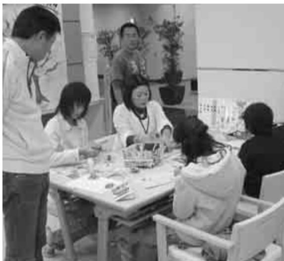
日曜情報センターでケロクルミーティング

12月2日におたかの森出張所ロビーで行われた日曜情報センターは、リサイクルやごみ減量について考える「ケロクルミーティング」ごみ処理の現状を紹介するパネル展示や、ごみ減量促進ポスター展のほか、新聞紙を利用したコサージュ作りが家族連れなどが挑戦しました。