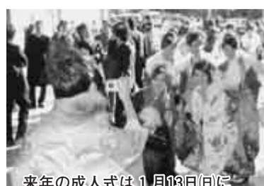
来年の成人式は1月13日(日)に

本市の成人式は、昭和58年度から新成人により構成された成人式実行委員会によって企画運営を行い、成人の日に挙行してきました。しかし、成人の日が平成12年から1月の第