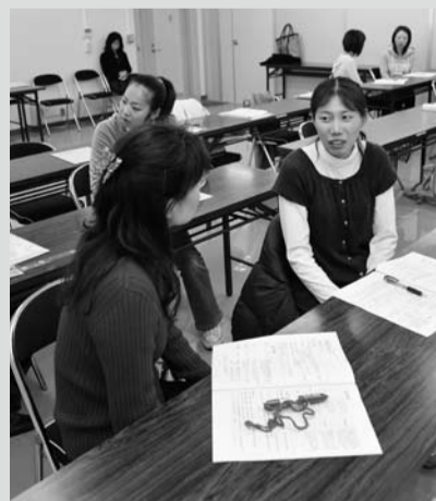
セミナーの最後に行われたワークショップ。この日は面接での受け答えを練習