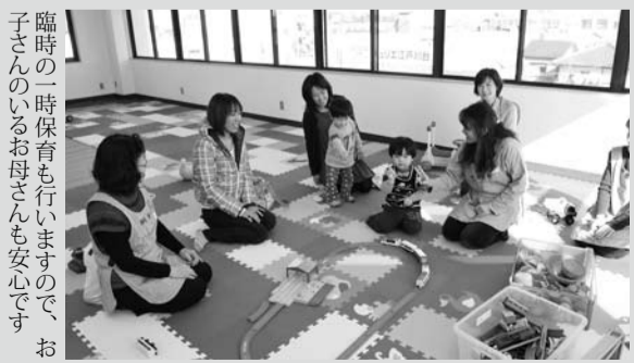
臨時の一時保育も行いますので、お子さんのいるお母さんも安心です。

昨年12月18日に行われた子育て中のお母さんと子育てを終えた女性の再就職をサポートするセミナー。地域職業相談室で開催され毎回好評を集めています。キャリアコンサルタントが、適職の選び方や履歴書の書き方、面接のポイントなどをわかりやすく解説。