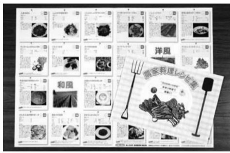
40種類の農家料理が掲載されているレシピ集。農政課や出張所、公民館などで配布しています

自ら生産した農産物を美味しく食べる料理方法や、地域を受け継がれている調理方法などを市内の農家から集め、