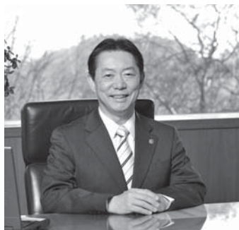
流山市長 井崎 義治