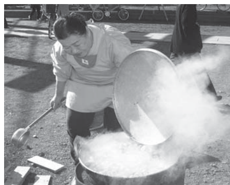
神前に供えた野菜など8種類の具をイモ汁に