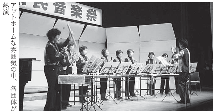
アットホームな雰囲気の中、各団体が熱演