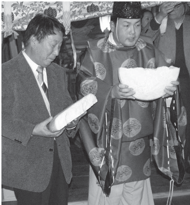
真ん中からきれいに割れた昨年は「豊作」と占われました

「8づくし」の祭事です。神 殿内で太鼓を合図に宮司に より祝詞が奏上され、お祓い が行われると、「トウ渡し」と 呼ばれる次の年番への引き継 ぎの儀式が厳粛に執り行われ ます。そしていよいよ、「餅取 り」の始まり。畳を上げ、危 険を避けるためにガラスを取 り外すと、社務所で控えてい た男衆が半被を着て境内を歩