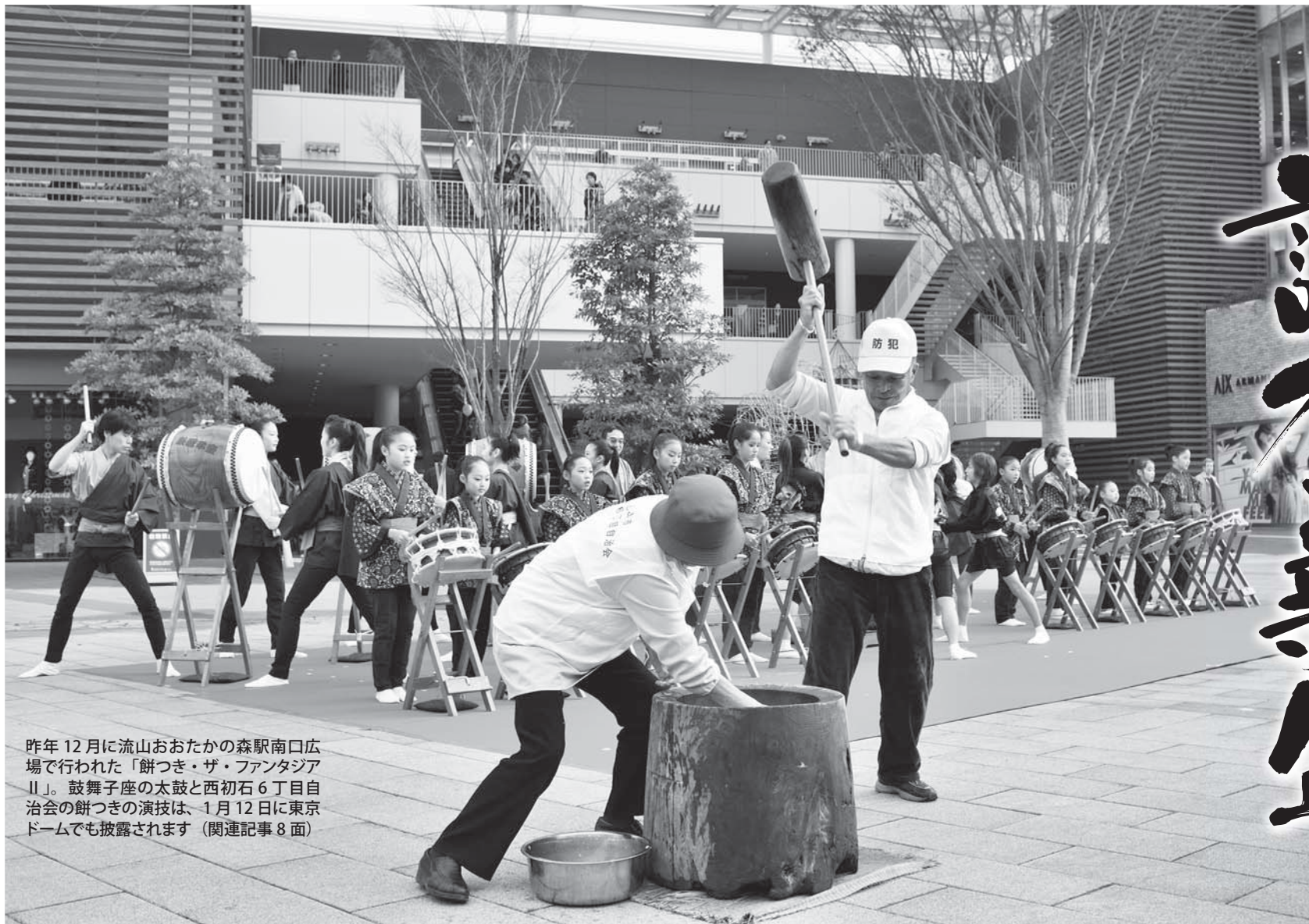
昨年12月に流山おおたかの森駅南口広場で行われた「餅つき・ザ・ファンタジアII」。鼓舞子座の太鼓と西初石6丁目自治会の餅つきの演技は、1月12日に東京ドームでも披露されます (関連記事8面)