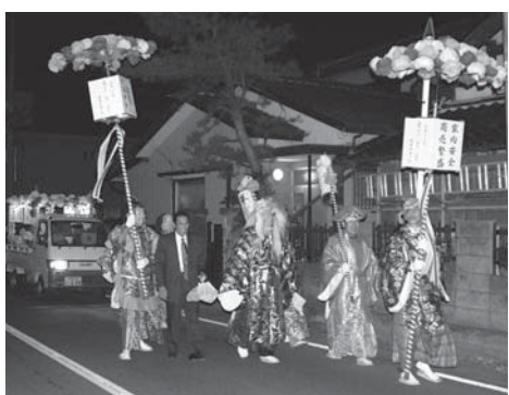
七福神による、来年度の受け当への「送り込み」

七福神の衣装がとてもきれいなので、初めて見る人でも十分楽しめると思いますね。こうした行事を見ることで、地元に対する愛着がわいてくることもあるんじゃないですかね。当番を受け持つ氏は、現在86軒あります。10年ほど前には100軒ありましたから、数自体は減っているのですが、この伝統行事を引き継いでいこうという若い人たちも多いので、将来のことはあまり心配していませんよ。