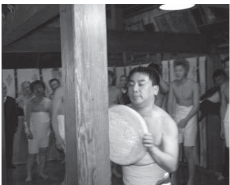
柱に餅を打ちつけてもびくともしません

き登殿。暖房ひとつない社 殿内で半被を脱ぐと、上半身 はさらし一枚になります。約 20人の男衆に神官から5升の 固い餅が投げ入れられると、 「ワッセ、ワッセ、餅はどこ だー」と掛け声をあげながら 餅を奪い合い、男衆たちがひ とかたまりとなって右へ左へ ともみ合いが続きます。餅 が割れるまでに要する時間は およそ20分から30分。時に餅 が固すぎて、柱に打ち付けて 割ることも…。餅が真ん中か らきれいに割れると、宮司か ら「ことは豊作間違いない ません」と告げられ、観客か らは大歓声が上がります。餅 取りが終わるとイモ汁が振る 舞われ、冷めやらぬ熱気を残 して一連の行事は幕を閉じま す。