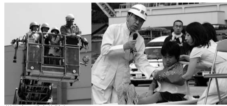
梯子車の乗車体験も 医師会等による救護訓練

当日は、要援護者の避難も想定した周辺自治会による会場までの避難誘導訓練を始め、陸上自衛隊、日本救助犬協会による救助訓練、医師会、歯科医師会による救護訓練、参加者による初期消火訓練、消防署・消防団による救助・救急および火災防備訓練などを行います。