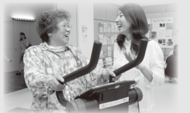
8月3日に日曜情報センターで行われた「ヘルスアップ体験教室」。たくさんの方が、エアロバイクや簡単な運動を体験しました。