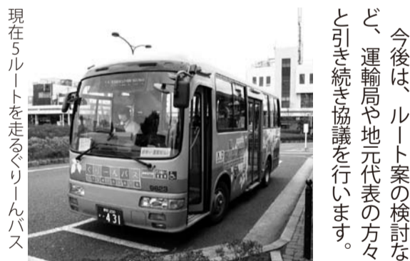
現在5ルートを走るぐりんバス

来年3月の導入を目的に準備を進めている「野々下・八木南団地循環ルート」については、八木地区自治会連合会関連の説明会で、運行経路や今後のスケジュール等が了承されたことから、開設に向けた手続きに入っています。運行事業者は、京成バス(株)に決定しバス停の設置位置については、検討委員会の協力と隣接地権者の方々のご理解をいただき、バス事業者が関東運輸局への事業認可申請を行いました。