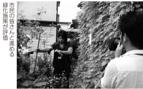
市民の皆さんと進める緑化施策が評価