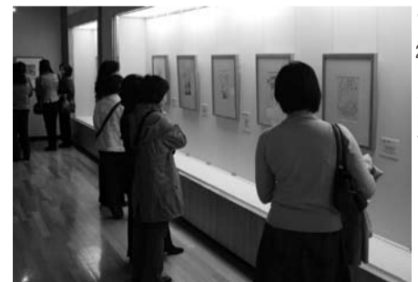
「星野富弘 花の詩画展 流山」は今年23日まで開催

11月26日に生涯学習センターで始まった「星野富弘 花の詩画展 流山」には、学校を通じて市内小・中学生に招待状を配布。ハンデを乗り越え、生き生きと創作活動を行う星野さんの作品に多くの子どもたちや市民が感銘を受けました。