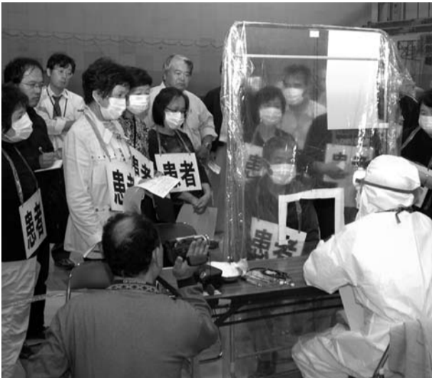
市民総合体育館で行われた「発熱外来地訓練」

体のトップを切って12月1日から集団的方式で始めています。さらに、ワクチンの優先接種者で、市民税非課税世帯及び生活保護受給世帯については接種費用を公費負担とします。