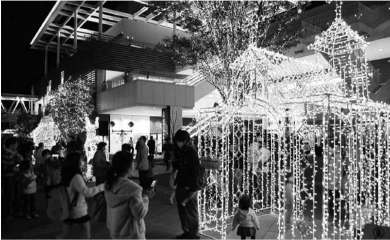
流山おおたかの森駅前のイルミネーションは今年25日まで開催

平成21年も残り2週間余り。皆さんにとって今年はどうな1年でしたか。本市では、市民の皆さんと議会・行政との関わりなどを明確にする、県内初の自治基本条例と県内2例目となる議会基本条例が同時施行されたほか、市民と行政の協働のイベントなどが多数開催され、より市民の皆さんと行政が近づいた年となりました。