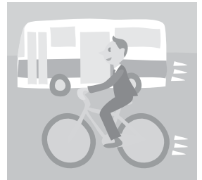
週2日往復8kmの車の運転をやめる