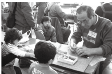
子ども笑顔が楽しみの「おもちゃ病院」の皆さん

市民団体「流山おもちゃ病院」の皆さんは、平成18年11月に公民館の「おもちゃドクター養成講座」を受講した16人の方が設立したボランティアグループです。現在では28人のおもちゃドクターが、公民館や森の図書館、幼稚園などで開院しています。診療は無料ですが、部品などの交換をした場合は実費負担となります。 関流山おもちゃ病院事務局・関谷 ☎ 7155-1863