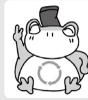
流山市ごみ減量・資源化キャラクター『ケロクル』

テーマ設定、会議の進行まで皆さんが主役です。ごみ問題に関する会議を行う際には、ぜひご相談ください。