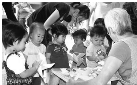
9月17日に行われた南流山ひだまりサロン

▷日時=10月21日（水）・28日（水）、11月10日（火）・20日（金）10時～12時 ▷場所=文化会館▷定員=40人 ▷申し込み=電話かファクス（住所、氏名、電話番号を明記）で文化会館へ 園文化会館☎7158-3462 FAX 7158-3442