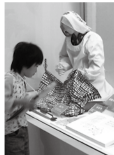
お裁縫をするちよつと昔のおかあさん