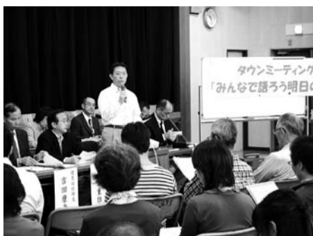
10月9日の初石会場には52人が参加

市民の皆さんの生の声をお聞かせいただくため、タウンミーティングを開催します。今回のタウンミーティングは、「子育て支援・健康長寿のまちづくり」をテーマに行います。