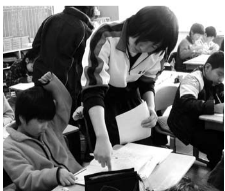
小学校で学習支援を行う中学生

①スプレー缶やカセットボンベ、ガスライターは使い切つて「有害・危険ごみ」の日にスプレー缶やカセットボンベ、ガスライターは燃やさないごみではありません。使い切つてから、「有害・危険ごみ」の日に出してください。 ②石油ストーブなどの着火用乾電池は取り外す。石油ストーブなどに入っている着火用の乾電池は取り外してから出してください(乾電池は「有害・危険ごみ」の日に出してください)。乾電池を入れたまま出すと、収集車の中で圧