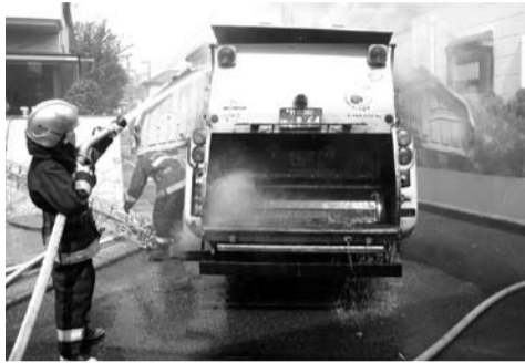
9月7日に発生した車両火災

①スプレー缶やカセットボンベ、ガスライターは使い切つて「有害・危険ごみ」の日にスプレー缶やカセットボンベ、ガスライターは燃やさないごみではありません。使い切つてから、「有害・危険ごみ」の日に出してください。 ②石油ストーブなどの着火用乾電池は取り外す。石油ストーブなどに入っている着火用の乾電池は取り外してから出してください(乾電池は「有害・危険ごみ」の日に出してください)。乾電池を入れたまま出すと、収集車の中で圧