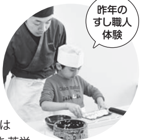
昨年のすし職人体験

仕事の世界に触れることも大切ですが、お寿司の作り方を覚えることで、家族みんなで食卓を囲んでコミュニケーションを深めるきっかけにもしてほしいと思います。