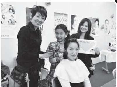
女の子に人気のメイクアップ体験

プロの指導の下にいろいろな仕事を体験することで、仕事をする楽しさ、社会の仕組みなどを子どもたちに実感してもらおう大好評の企画。今回も事前のチケット販売を行います。お早めにお買い求めください。