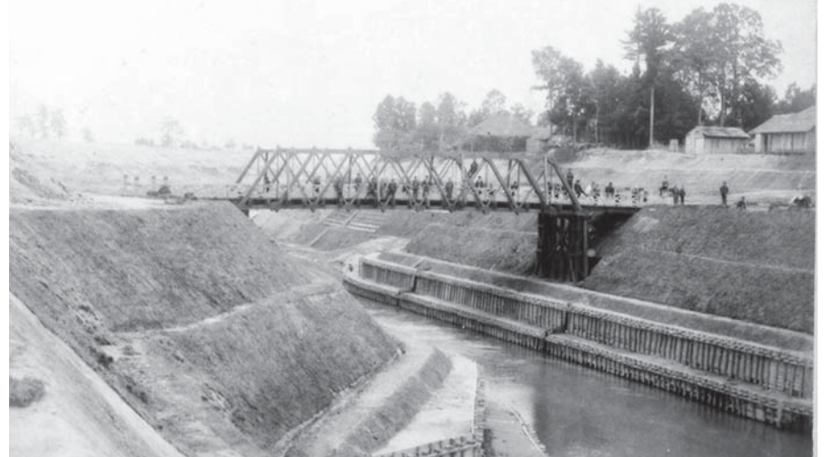
明治29年頃の運河橋付近

120年の節目を記念し、全国運河サミットや近隣の博物館では合同の特別企画展も開催されます。この機会に利根運河の歴史を学び、将来像についても考えてみませんか。