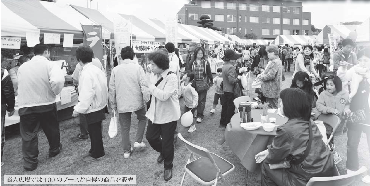
商人広場では100のブースが自慢の商品を販売

10月24日(日)、生涯学習センターで、「流山産業博 2010」を開催します。今年も「魅力再発見!NAGAREYAMA」をテーマに、商人広場において多数の商工業者が自慢の商品の販売、展示PRなどを行います。約100のブースに流山を代表する製品、技術、味覚、サービスなどが集まりますので、この機会にわがまち"流山"の魅力をつぶりと味わってください。