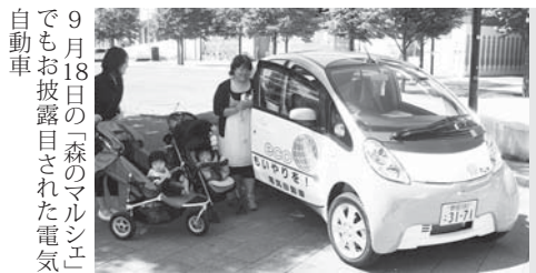
9月18日の「森のマルシェ」でもお披露目された電気自動車

市では、資源物持ち去りパトロールや環境イベントなどで活用し、電気自動車の環境性能や利便性をPRしていきます。