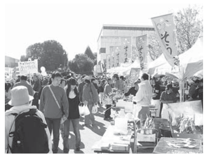
毎年多くの方で賑わう市民まつり

今年も市民手作りの市民まつりを実施するため、スタッフとして参加して下さるボランティアを募集します。また、青空市の出店者も合わせて募集します。