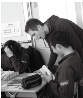
ALTから発音を学ぶ中学生

6月3日(月)から、江戸川台東ルートのバス停「老人福祉センター入口」の名称を「森の図書館」に変更します。