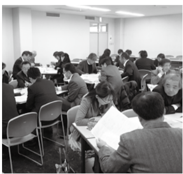
活発に意見交換を行う小・中学校の教員

●英語教育のサポート ALIT(アシスタント・ランゲージ・ティーチャー)は、日本人の先生が外国語の授業を行う時にサポートしたり、教材を準備したりする外国人の先生のことです。国際社会の中で、外国の方とも積極的にコミュニケーションがとれ、自国の文化や特徴を説明できる力が必要とされています。そのため、平成24年度から全ての中学校にALITを配置し、英語をより身近に感じられる環境を整えています。また、中学校へ進学後、英語学習をスムーズに行えるように、小学校にも外国人の小学校英語活動アドバイザーを派遣し、英語活動のサポートやアドバイスをしています。さらに、全小学校に英語活動指導員(注)