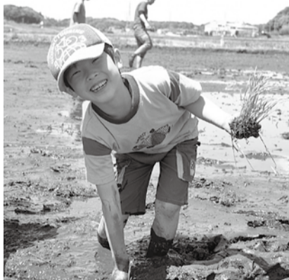
泥んこになるのも、田植えをするのも貴重な体験