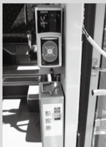
運賃のお支払いは、ICカードのご利用が便利です

②ICカードの場合：整理券と乗り継ぎ券を乗務員に提出したのち、乗務員の指示により読み取り機にタッチしてください。