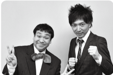
漫才コンビ・コンパス

流山の漫才コンビ・コンパスと、「球世主!!」の原作者・青木健生さんとの異色のコラボレーション。ほかでは見ることができないステージをお楽しみください。