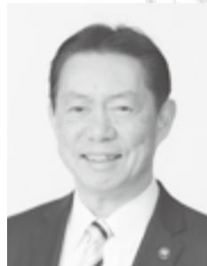
流山市長 井崎 義治