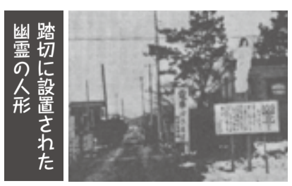
踏切に設置された幽霊の人形