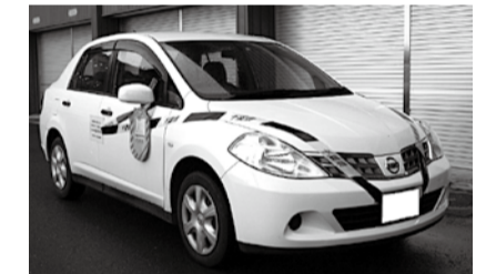
差押えを示す公示書を鍵付きのワイヤで取り付けるミラズロック

千葉県松戸県税事務所 ☎047-361-2168 千葉県税務課 ☎043-223-2127