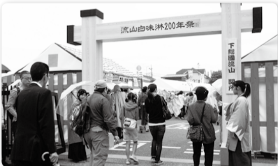
「関所」をくぐって流山白味淋200年祭の会場へ

今では和食に欠かせない存在となっている隠し味の王様・みりん。さかのぼること200年前の1814年(文化11年)、それまでの赤褐色のみりんとは違った、透明でやまぶき色をした白みりんがここ流山で誕生しました。白みりん200周年に関連したイベントが多数行われ、テレビ東京の人気番組「出沒! アド街ッ天国」など多くのメディアで取り上げられました。つくばエクスプレス沿線開発で「新しいまち」のイメージも強い流山ですが、昔から刻まれてきた歴史を魅力としてあらためて認識する機会となりました。