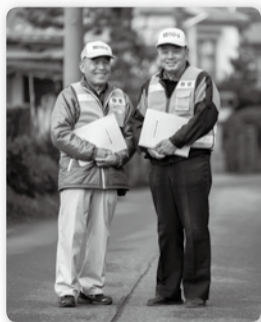
地域で行う見守り活動(イメージ)

また、一人暮らしの高齢者の方などが住み慣れた地域で孤立することなく、安心して暮らすことができるまちづくりの一環として、「地域支え合い活動推進条例」を制定しました。この条例は、地域での日常的な見守り活動や災害時の避難支援などの活動を行う自治会などに対して、支援を必要とする方に関する情報(名簿)をあらかじめ提供できるよう必要な事項を定めたものです。今後、条例に基づき、対象となる方に意思確認を行った上で、希望する自治会などと情報の取り扱いに関する協定を締結し、名簿管理者を届け出いただいた後、来年4月から名簿の提供を開始する予定です。