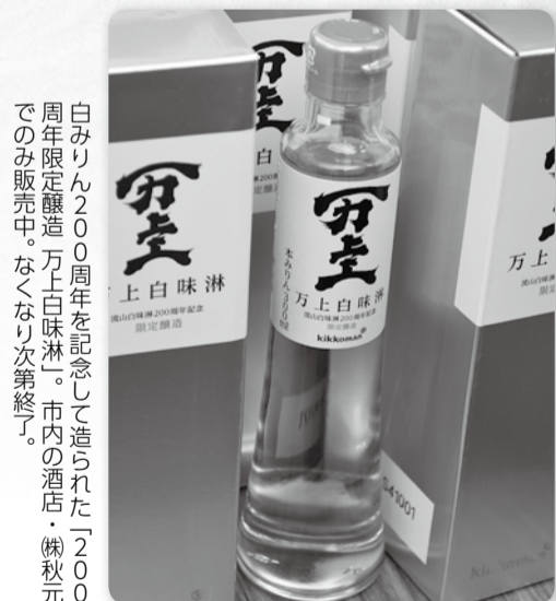
白みりん200周年を記念して造られた「200周年限定醸造 万上白味淋」。市内の酒店・(株)秋元でのみ販売中。なくなり次第終了。