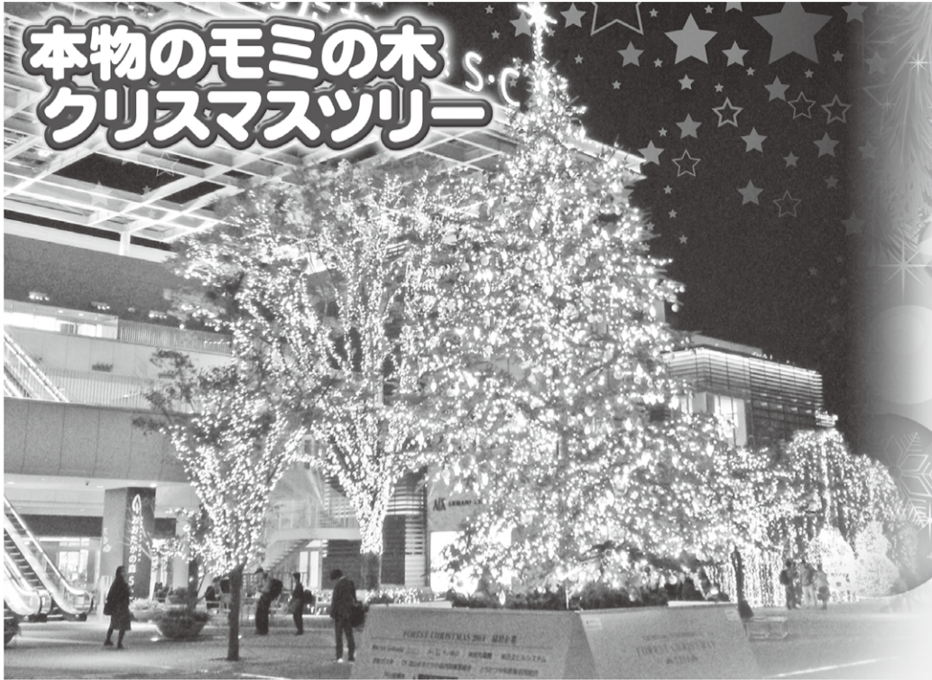
流山おおたかの森S・C前で光り輝くイルミネーション