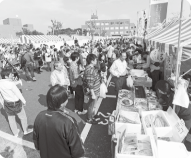
第36回流山市民まつり