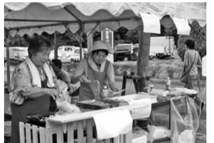
今年6月に開催された夏まつり