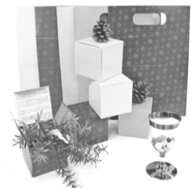
※写真は飾り付けのイメージです。

事やカフェ、雑貨など約20店舗が並びます。また、家に飾ったり、プレゼント箱に使っていただける「hokkori-hako」(先着1000個)