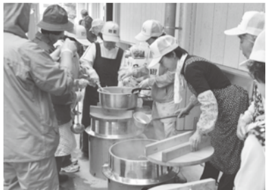
市境を越えた9自治会が連携した美田自治会の防災訓練