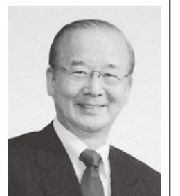
NHKの「ためしてガッテン」などにも出演

☎流山市歯科医師会 ☎FAX7155-3355 保健センター ☎7154-0331 FAX7155-5949