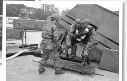
倒壊家屋からの救助訓練

日 10月5日(日) 9時30分～12時※雨天中止 所 おおたかの森スポーツフィールド コミュニティプラザ(展示)