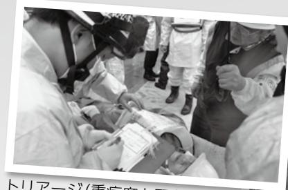
トリアージ(重症度と緊急性による分別)