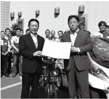
(株)セブニーレブン・ジャパンとの締結式

協定は、他市とも同様の協定を締結していますが、高齢者の雇用促進まで踏み込んだ協定の締結は、市町村単位では千葉県初となります。