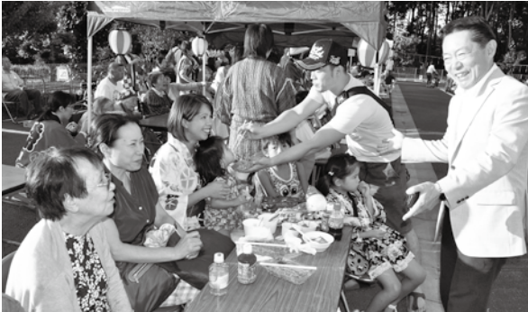
9月13日、特別養護老人ホーム月の船と城の星おおたかの森保育園と合同で行われた秋祭りにて

また、新川耕地内に移転・整備する予定の新たなスポーツフィールドについては、サッカー場、駐車場、日陰や修景のための植栽、管理棟や倉庫を整備する方向で検討しています。