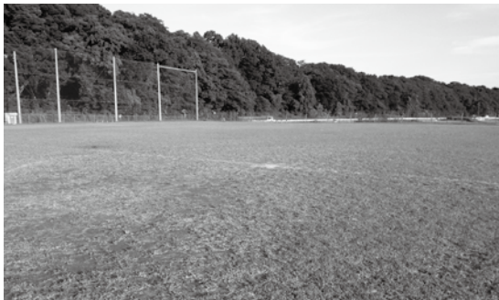
移転・整備予定の新川耕地スポーツフィールド

見直しに当たっては、見直し案の概要に関する説明会を7月26日および27日に文化会館で開催し、8月5日から9月4日まで縦覧を行いました。今後は、流山市景観計画の変更案の縦覧、都市計画審議会の審議を経て今年度内の見直しを目指します。