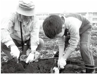
昨年のおいも掘り