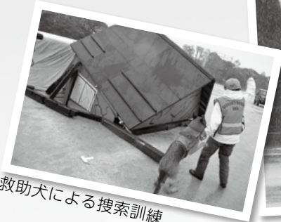
救助犬による捜索訓練