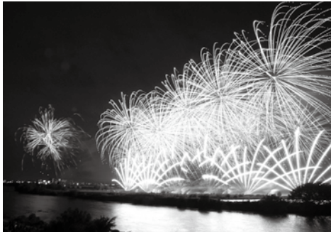
扇形に打ち上げる演出は今年が初めて