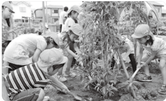
昨年、キンモクセイを植えた向小金保育所の子どもたち

5月22日は「国際生物多様性の日」。国連の呼びかけで、世界各地の子どもたちが、現地時間の午前10時に植樹などを行います。 この植樹は、地球上の東から西へ波のように広がることから「グリーンウェイブ(緑の波)」と呼ばれています。 日本では、平成21年から環境省の呼びかけで、各地域で植樹が行われています。 流山市は、平成22年度から毎年グリーンウェイブに参加 しており、今年度は市内の小・中学校6校で、児童・生徒が114本の植樹を行います。 この事業は、単に植樹を行うだけでなく、次世代を担う子どもたちに生物多様性について考えるきっかけとなることを目的としており、これまで市内小・中学校、保育所、幼稚園などの公共施設に計275本の植樹を行いました。 環境政策・放射能対策課 ☎7150-6083