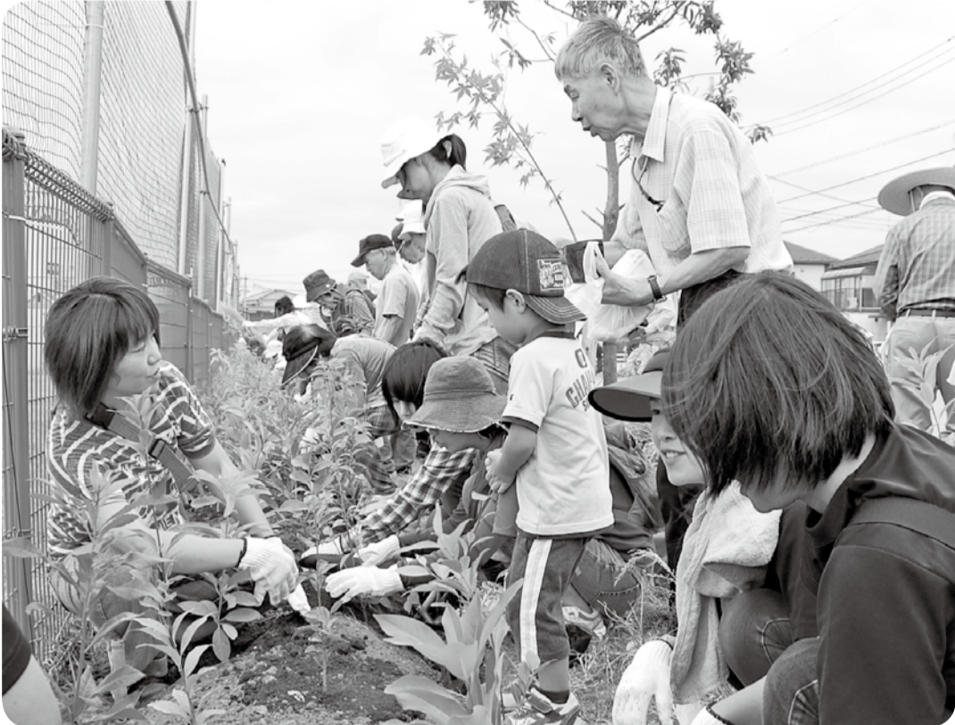
昨年度の「まちなか森づくりプロジェクト」では、新東谷防災広場をはじめ、ほっとプラザ下花輪、鱈ヶ崎小学校、クリーンセンター、南流山中学校で、児童・生徒や市民の方が約1万本の苗木の植樹を行いました。