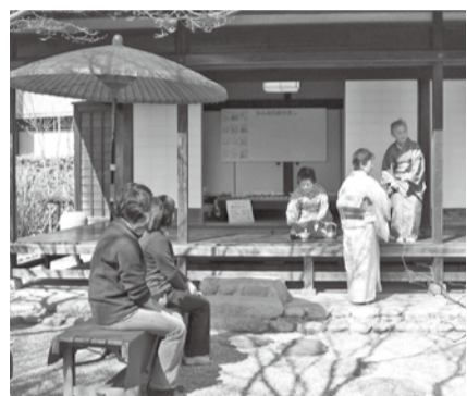
★は市または指定管理者などの主催のもの