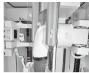
さまざまな角度から胃の写真をとります

この胃がん検診は、バリウム検査です。むせやすい方や便秘の方は、受診に注意が必要な場合がありますので、事前に保健センターへご相談ください。また、体の向きを変えて撮影しますので、手や足を痛めている方や体を支える力に自信のない方も、事前にご相談ください。がん検診は「自覚症状のない健康な人」から「異常のある可能性の高い人」を選び出し、がんの早期発見・治療につなげるものです。健康な方こそがん検診を受診しましょう。また、自覚症状のある方は、早めに医療機関を受診してください。