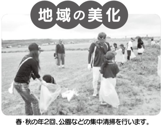
春・秋の年2回、公園などの集中清掃を行います。

また、地震などの大規模災害が発生した場合、建物の倒壊などにより消火や救出活動が遅れることが想定されます。こうした時、個人ではなく団体が組織として行動することが、避難や救助活動にも大きな力を発揮します。自治会では防災訓練を行うところも多く、いざという時のために防災備蓄品を備えているところも少なくありません。