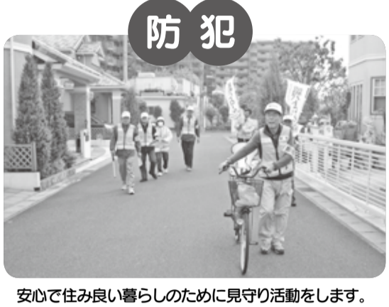
安心して住み良い暮らしのために見守り活動を行います。