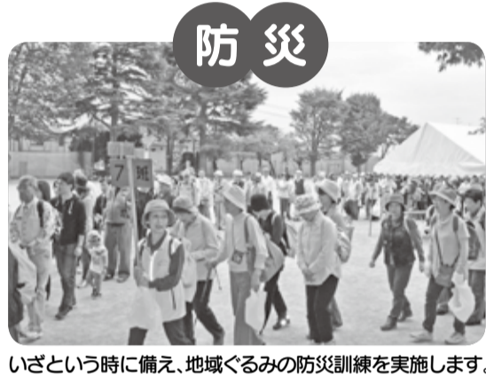
いざという時に備え、地域ぐるみの防災訓練を実施します。