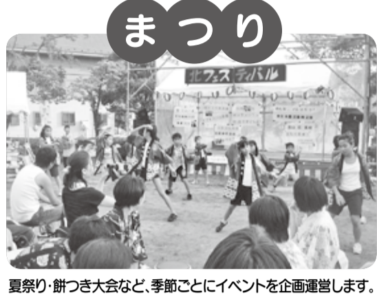
夏祭り・餅つき大会など、季節ごとにイベントを企画運営します。

自治会に加入するには… なお、市からの配布物やお知らせなども自治会を通じて行っています。