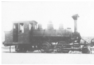
大正14年に入線したサドルタンク機関車

この蒸気機関車の一輛は、頸城鉄道(新潟県東頸城郡)から譲りうけたもの。他の一輛は川崎付近で土工に使われていたものを買い入れたと言われるが、この最初の蒸気機関車は、どうやって流山に運ばれたのか。記者の疑問に答えてくれたのは、流山一丁目の流鉄