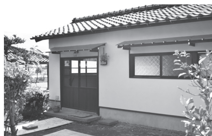
井戸小屋から生まれ変わったカナルファームido

市の流山本町・利根運河ツーリズム推進事業補助金を活用し、3月30日にオープン。古くからある井戸小屋を改修し、カナルファーム(下記参照)で採れた野菜や果物、ジャム、みりんを使った焼菓子の販売を行います。また、野菜の収穫体験や、農園で採れた野菜を使った料理教室なども行う予定です。