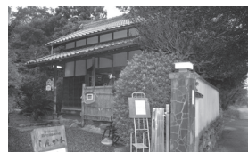
門を入って右側にあるギャラリー。自由に鑑賞できます

利根運河の風景写真などを展示している、蔵を改装したギャラリー。散策の休憩場所としてもご利用になれます。また、明治創業の割烹や、旧館を利用したブラスリー(フレンチ)もあります。 ☎7152-1008(月曜休み)