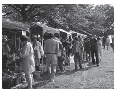
「うんがいい! 朝市」の様子

利根運河の歴史や自然環境の資料展示のほか、毎月第4土曜に、運河水辺公園で「うんがいい! 朝市」を開催。レンタサイクル(半日250円、1日500円)もあります。 ☎7153-8555(月・火曜休館、祝日の場合は翌日)