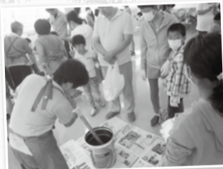
廃油を使った石けんづくり

所クリーンセンター ☎小・中学生 ※保護者同伴。兄弟姉妹や友人同士で参加の場合は、1グループにつき保護者1人でも可 申電子申請または復旧ハガキ(1枚で複数講座申し込み可)に開催日、講座名、住所、参加者名と学年、電話番号、返信用に宛名を明記の上、7月13日(必着)までに☎270-0174流山市下花輪191クリーンセンターへ