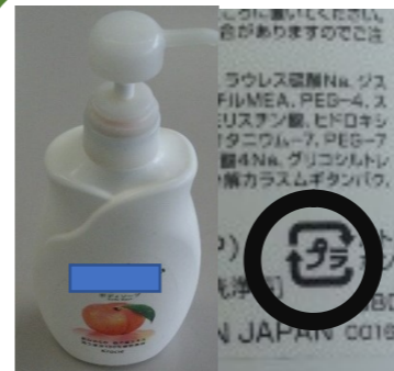
シャンプーの容器