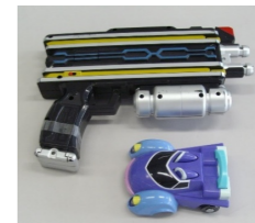
こどものおもちゃ