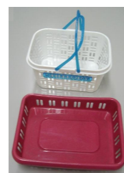
バスケット・トレイ