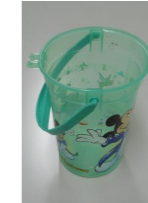
おもちゃのバケツ