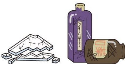
ガラス製品 (ガラスの破片、化粧品のビンなど)