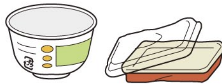
カップめん等の容器 (カップめん、お弁当など)