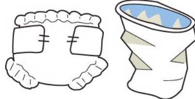
資源にならない紙くず (ちり紙、カーボン紙、写真、おむつなど)