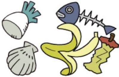
台所ごみ (生ごみ、卵・貝の殻、茶殻など)