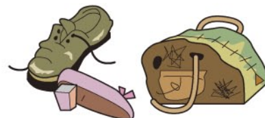
革製品 (靴、靴、ベルト、手袋など)