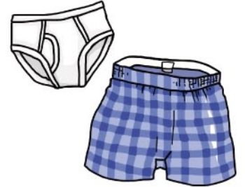
資源にならない布類 (肌着、靴下、ストッキング、ぼろ布など)