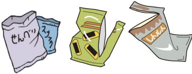
食品の袋 (お菓子、レトルト食品、冷凍食品など)