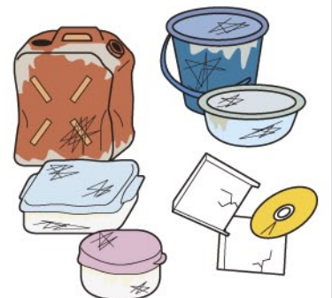
その他プラスチック製品 (バケツ、灯油タンク、CDなど)