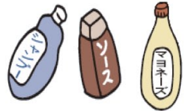
その他のプラスチック容器 (シャンプー、調味料など)