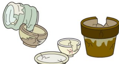
陶磁器製品 (せともの、茶碗、植木鉢など)