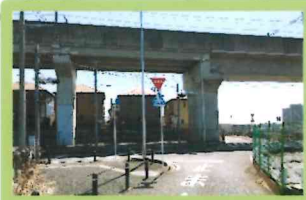
横断歩道を渡り、 TXをくぐります。