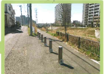
4 川沿いの遊歩道に 降りていきます。