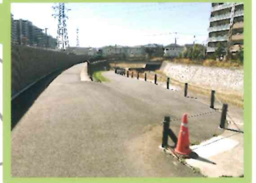
4 川沿いの遊歩道に 降りていきます。