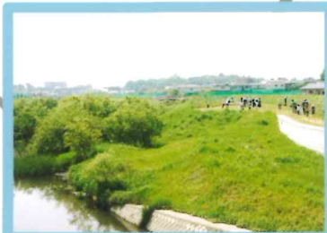
大堀川 と 遊歩道