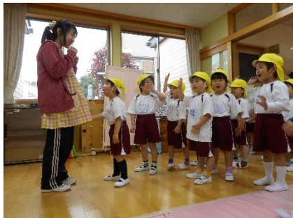
毎日ワクワクがいっぱい！