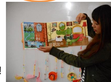
お家の方の読み聞かせ