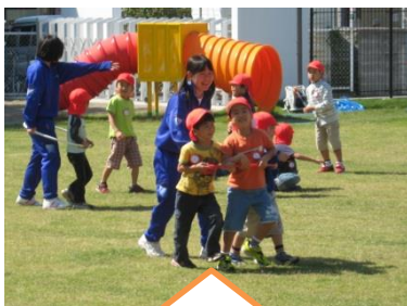
お兄さん、お姉さんってやさしいな！