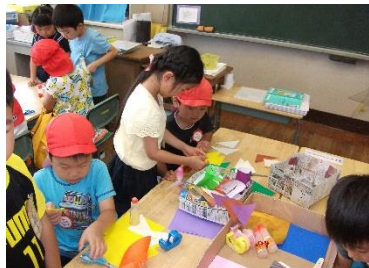
小学生に教えてもらったよ！