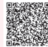
▲電子申請 二次元コード