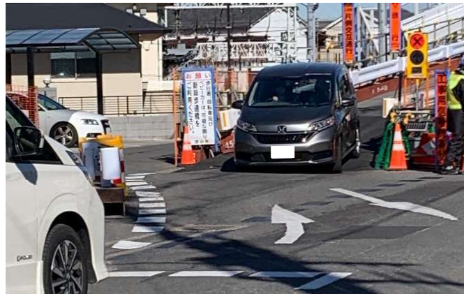
工事用信号による交通処理状況