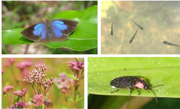
生物多様性ながれやま戦略 第二期(2018(平成30)年度~)