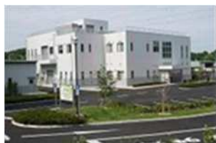
森のまちエコセンター

収集時に剪定枝（束）の点数を確認後、必要な処理券（枚数）を購入していただきます。